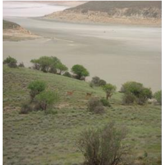
شکل ۲: سیمای بهاره زیستگاه گوزن زرد ایرانی در جزیره اشک، پارک ملی دریاچه ارومیه (بهار ۱۳۹۰)

موجود در جزیره اشک: اما بر طبق پژوهش انجام شده در ۱۳۶۸، فلور این جزیره مشتمل بر ۱۹۸ گونه متعلق به ۱۴۹ جنس از ۴۶ خانواده بوده است، که ۱٪ گونه‌ها باز دانه، ۱۴٪ تک لپه و ۸۵٪ متعلق