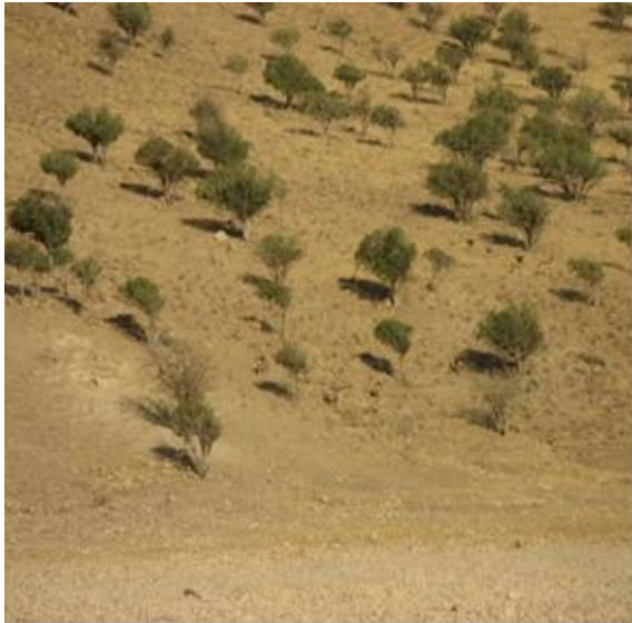
شکل ۳: سیمای تابستانه زیستگاه گوزن زرد ایرانی در جزیره اشک، پارک ملی دریاچه ارومیه (تابستان ۱۳۹۰)

به دو لپه‌ای‌ها می‌باشد (زهزاد، ۱۳۶۸). لذا با توجه به عدم مشخص بودن و وجود نقشه تیپ‌های گیاهی تصمیم گرفته شد که جزیره بر اساس شیب و وجود آب به چهار زیستگاه تقسیم شود. که این چهار زیستگاه عبارتند از: مناطق دشتی، دامنه پرشیب و سنگلاخی، چشمه و دامنه شرقی، دامنه شمالی. و بر این اساس پلات‌های نمونه‌برداری در زیستگاه‌های مختلف به صورت تصادفی - سیستماتیک پراکنده شدند.