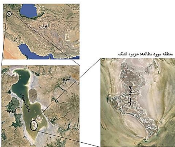
شکل ۱: تصویر ماهواره‌ای منطقه مورد مطالعه (جزیره اشک)، موقعیت در کشور و دریاچه ارومیه

منطقه مورد مطالعه: با توجه به این که این پژوهش در سال‌های خشک دریاچه ارومیه انجام شد وسعت این جزیره با استفاده از نقشه ۱:۵۰۰۰۰ جزیره اشک که از سازمان جغرافیایی نیروهای مسلح تهیه شد در حدود ۲۹ کیلومترمربع (۲۹۰۰ هکتار) در نظر گرفته شد.