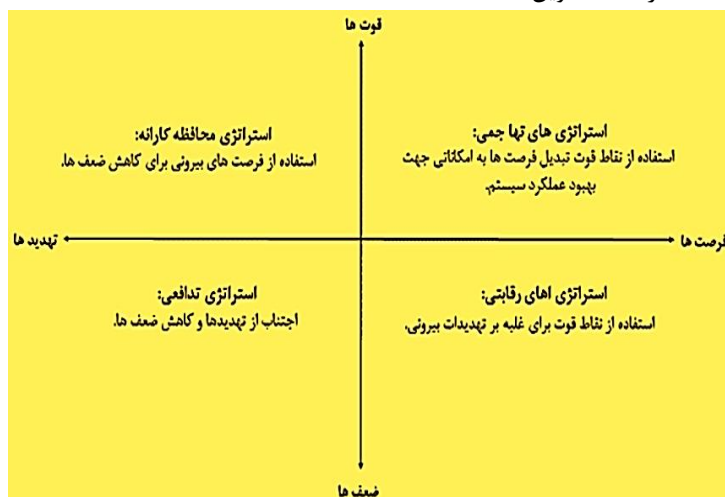
شکل ۲: استراتژی‌های مطرح در مدل SWOT

۴ دسته تقسیم می‌گردند (شکل ۲) که در این مطالعه ۳ استراتژی از هر دسته تدوین گشت.