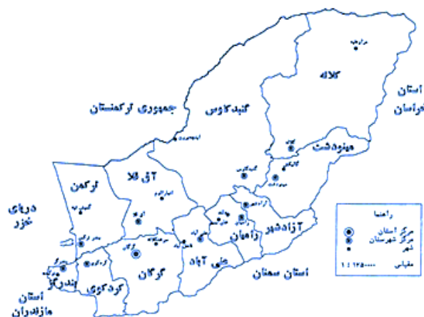
شکل ۱: نقشه موقعیت محدوده مورد مطالعه در استان گلستان

آبزی مانند رودخانه‌ها، آب‌بندان‌ها، استخرهای پرورش ماهی استان گلستان نمونه‌برداری انجام شده است. در جدول ۱ مختصات جغرافیایی مربوط به هریک از ایستگاه‌های نمونه‌برداری گزارش شده است. جمع‌آوری نمونه‌ها در فصول تابستان، پاییز و زمستان سال ۱۳۹۵ و بهار سال ۱۳۹۶ انجام و ابزار مورد استفاده در این مطالعه، شامل دوربین دیجیتال، تور، سطل برای جمع‌آوری نمونه‌ها بود و ۲۵ صفت مورفومتریک به‌وسیله کولیس دیجیتال با دقت ۰/۰۱ میلی‌متر مورد بررسی و اندازه‌گیری قرار گرفت.