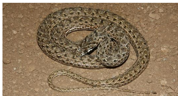
شکل ۱۰: یله مار Malpolon insignitus fuscus