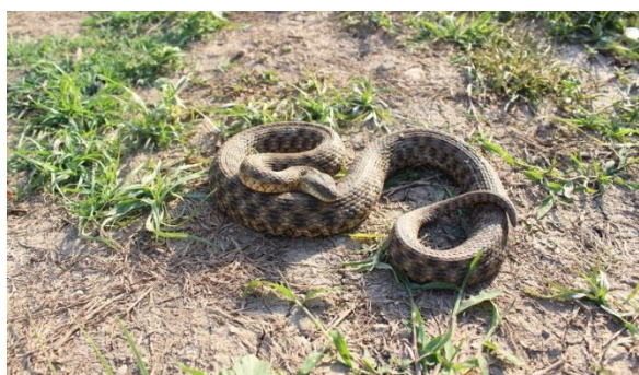
شکل ۱۲: مار چلیپر Natrix tessellata