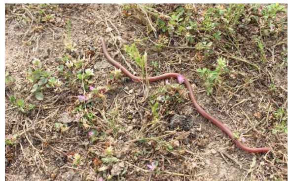
شکل ۱۳: مار کرمی شکل Xerotyphlops vermicularis