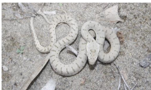
شکل ۸: مار پلنگی Hemorrhois ravergieri