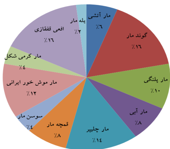
شکل ۳: نمودار درصد فراوانی مارهای منطقه حفاظت شده اساس