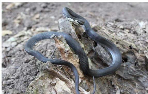
شکل ۹: مار موش خور ایرانی Zamenis persicus