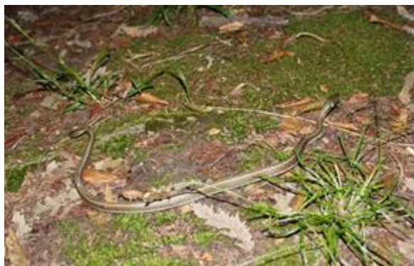
شکل ۱۱: مار آبی Natrix natrix persa