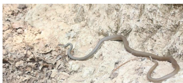
شکل ۵: تمچه مار Platyceps najadum najadum