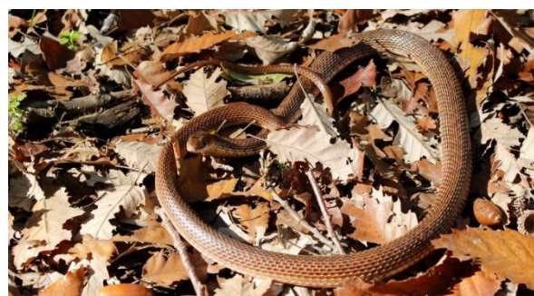
شکل ۶: مار آتشی Dolichophis schmidtii