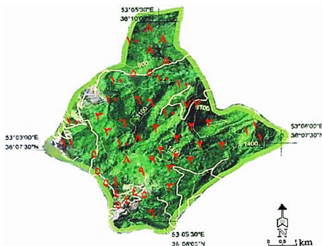
شکل ۱۵: نقشه پراکنش مارهای منطقه حفاظت شده اساس ۱: مار آتشی، ۲: گوند مار، ۳: مار پلنگی، ۴: مار آبی، ۵: مار چلیپر، ۶: قمچه مار، ۷: سوسن مار، ۸: مار موش خور ایرانی، ۹: مار کرمی شکل، ۱۰: افعی قفقازی، ۱۱: یله مار

از خانواده Viperidae یک گونه Gloydius halys شناسایی شد. گونه Gloydius halys از پارک ملی شهیدزراع (حجتی و همکاران، ۱۳۸۸) و دو گونه Gloydius halys و Macrovipera lebetina از پارک ملی کیاسر (حجتی و همکاران، ۱۳۹۰) گزارش شده بودند. از استان مازندران سه گونه Gloydius halys ، Macrovipera lebetina و Macrovipera lebetina (لطیفی، ۱۳۷۹) و چهار گونه Gloydius halys ، Montivipera latifii و Vipera eburni ، Macrovipera lebetina