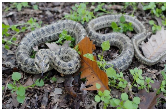
شکل ۷: گوند مار Elaphe dione