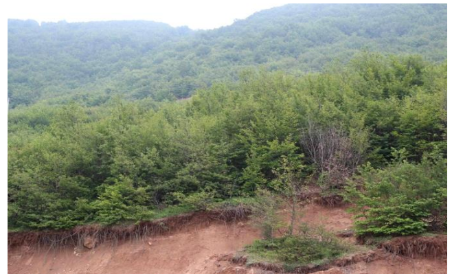
شکل ۱: نمایی از پوشش گیاهی منطقه حفاظت‌شده اساس در استان مازندران