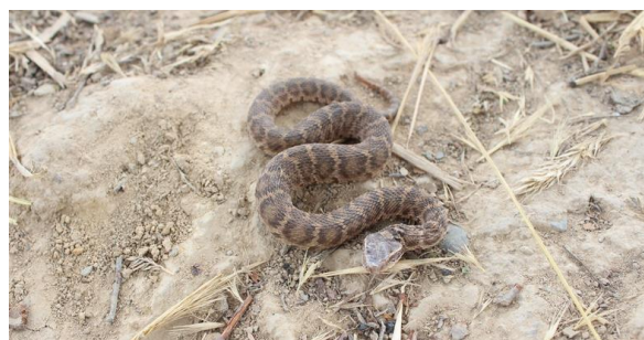
شکل ۱۴: افعی قفقازی Gloydius halys caucasicus