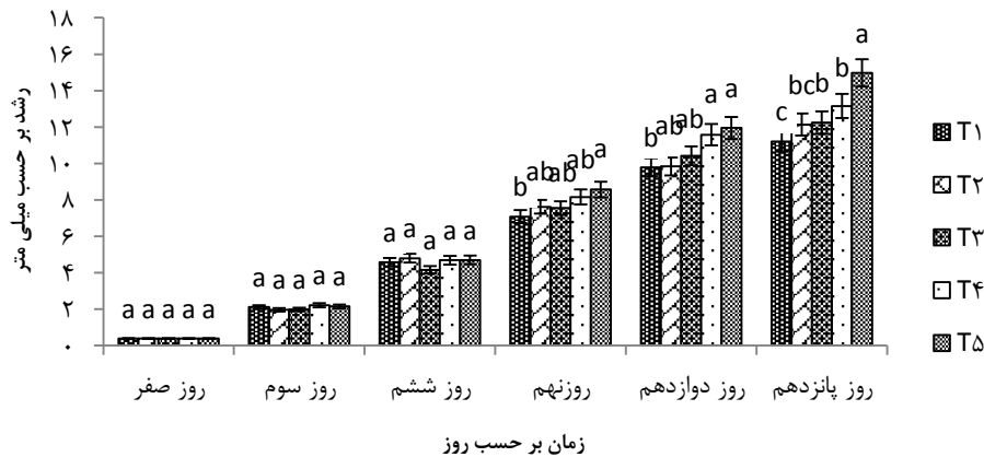
شکل ۱: رشد P. spinosa در تیمارهای غذایی مختلف

با افزایش روزهای پرورش به‌خصوص در روز پانزدهم به‌خوبی دیده می‌شود. بیش‌ترین میزان رشد در تغذیه با تراکم 9.0 \times 10^6 cells ml -1 و کم‌ترین میزان رشد هم در تراکم 1.8 \times 10^6 cells ml -1 مشاهده گردید. بین تیمارهای دو، سه و چهار هم در نهایت اختلاف معنی‌داری از لحاظ رشد مشاهده نگردید ( p < 0.05 ). در کل