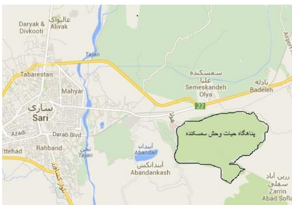
شکل ۱: نقشه مکانی پناهگاه حیات وحش سمسکنده

دمارتن به صورت اقلیمی مرطوب تا نیمه مرطوب معتدل است. ماه‌های خرداد، تیر، مرداد و شهریور، خشک و ماه‌های فروردین، اردیبهشت، مهر، آبان، آذر، بهمن و اسفند، مرطوب و نیمه‌مرطوب است. نمونه‌برداری توسط آگر به قطر ۲۰ سانتی‌متر و سطح مقطع ۳۱۴ سانتی‌متر مربع انجام شد. برای برآورد ساختار جمعیتی در لایه‌های مختلف خاک، نمونه‌های خاک جمع‌آوری شده به سه بخش شامل بستر خاک (خاک‌برگ)، لایه ۰-۳ سانتی‌متر و لایه ۳-۶ سانتی‌متر تقسیم گردید. در هر بار نمونه‌برداری هشت نمونه تصادفی به فاصله ۱۰ متر از یکدیگر برداشته شد. نمونه‌برداری به نحوی صورت گرفت که در هر فصل سال نمونه‌برداری انجام گرفته باشد. جداسازی بندپایان از خاک توسط حرارت در قیف برلیز صورت گرفت و نمونه‌های خاک آن‌قدر در دستگاه باقی ماندند تا همه بندپایان از خاک خارج شوند و خاک کاملاً خشک گردد. بندپایان جدا شده در اتیلن گلیکول جمع‌آوری شد و به منظور شمارش و شناسایی به اتانول ۷۰٪ منتقل شدند. نمونه‌های شبه‌عقرب ذخیره شده در الکل به منظور شناسایی برای دکتر مهرداد نصیرخانی از کرمان و نمونه‌های جورپایان ذخیره شده در الکل به منظور شناسایی برای دکتر استفانو تائیتی در موسسه ملی شورای پژوهش مطالعات زیست‌بوم ایتالیا فرستاده شد و گونه‌ها توسط متخصصین شناسایی و تایید شدند. پس از شمارش نمونه‌ها به‌ازای سطح مقطع ۳۱۴ سانتی‌متر مربع، تراکم مجموع جورپایان و شبه‌عقرب‌ها به‌ازای هر مترمربع محاسبه گردید. میانگین تراکم آن‌ها در زمان‌های مختلف نمونه‌برداری و نیز لایه‌های مختلف توسط تجزیه و تحلیل واریانس یک‌طرفه (ANOVA-1) و به کمک نرم‌افزار SPSS (ver. ۱۹) مورد بررسی قرار گرفت.