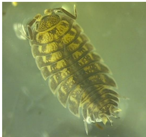
شکل ۴: شکل کلی گونه Trachelipus pieperi

مواد بررسی شده: ۳ نمونه (♂، ♀)، ایران، استان مازندران، ساری، جنگل سمسکنده، طول جغرافیایی ۳۵° ۹' ۵۳" شرقی تا ۳۶° ۳۲' ۵۵" شمالی. تعداد شمارش شده: ۹۰ عدد