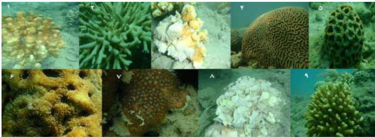
شکل ۱: تصویر کلنی‌های مطالعه شده. ۱: Porites compressa ، ۲: Acropora downingi ، ۳: Psammocora contigua ، ۴: Platygyra daedalea ، ۵: Favia pallida ، ۶: Acanthastrea echinata ، ۷: Leptastrea transversa ، ۸: Pavona decussata ، ۹: Stylophora pistillata

تهران منتقل شد. در آزمایشگاه، با استفاده از بافر و دستگاه شست و شو با هوا (Air Brush) زوگزانته‌ها از درون بافت مرجان جدا شدند. بعد از جداسازی زوگزانته DNA نمونه‌ها با روش CTAB (cetyl trimethyl ammonium bromide) و کلروفرم استخراج شد (Baker، ۱۹۹۹). واکنش زنجیره‌ای پلیمرز (PCR) با استفاده از سه جفت آغازگر اختصاصی انجام شد. آغازگرهای اختصاصی کلاد A (آغازگر پیشین: ۳- CCTCTTGGACCTTCCACAAC-۵، آغازگر پسین: ۳- GCATGCAGCAACTGCTC-۵) (قطعۀ ژنی ITS۱-۵.۸) S- ITS۲ را تکثیر (Correa و همکاران، ۲۰۰۹)، آغازگرهای اختصاصی کلاد C (آغازگر پیشین: ۵- AAGGAGAAGTCGTAACAAGGTTTC-۵، آغازگر پسین: ۳- AAGCATCCCTCACAGCCAAA-۵) قطعۀ ژنی ITS۱ را تکثیر (Ulstrup و van Oppen، ۲۰۰۳) و آغازگرهای اختصاصی کلاد D (آغازگر پیشین: ۵-