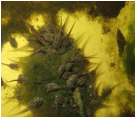
شکل ۶: تغذیه لاروها با جلبک