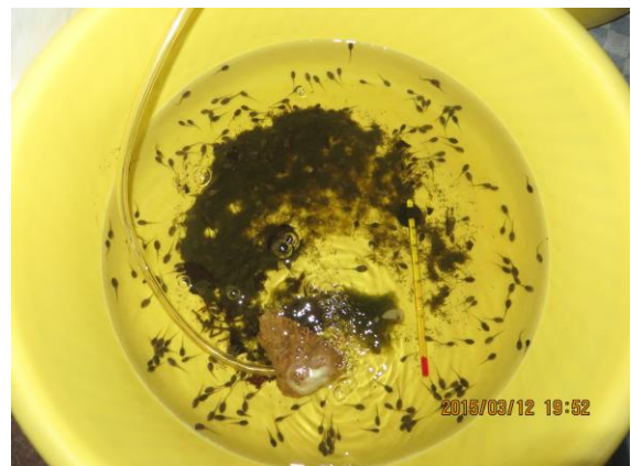
شکل ۸: نگهداری نمونه‌ها در محیط آزمایشگاه