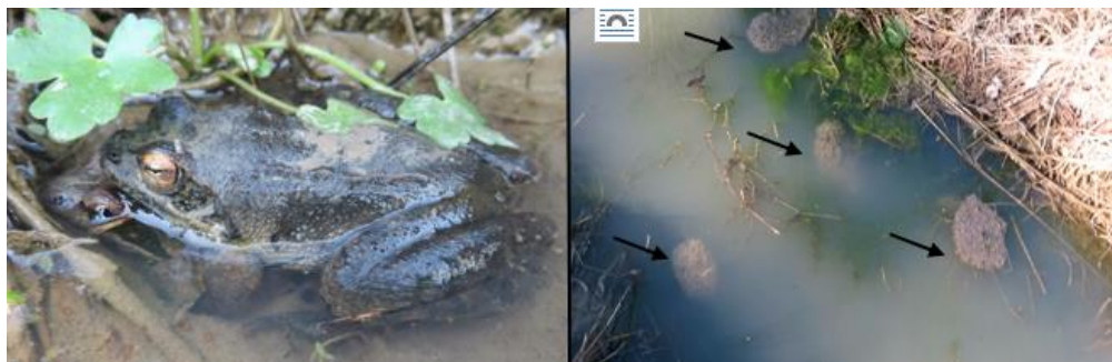
شکل ۳: مکان تخم‌گذاری قورباغه جنگلی در مسیر جنگل گرجی محله. توده‌های تخم در قسمتی از آبگیر موقتی بزرگ (سمت راست)، جفت در حال آمپلکسوس (سمت چپ)