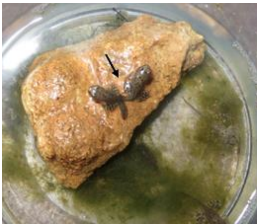
شکل ۷: اواخر دگرذیسی قورباغه جنگلی در خارج از آب