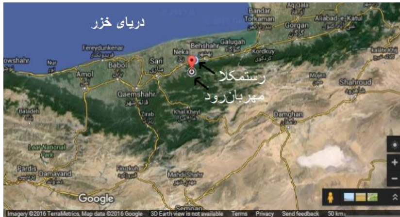
شکل ۱: منطقه مورد مطالعه در جنوب شهر رستمکلا