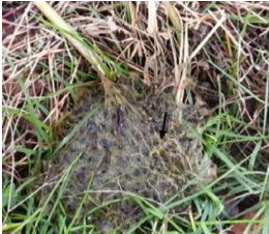
شکل ۹: از بین رفتن تخم‌ها در طبیعت