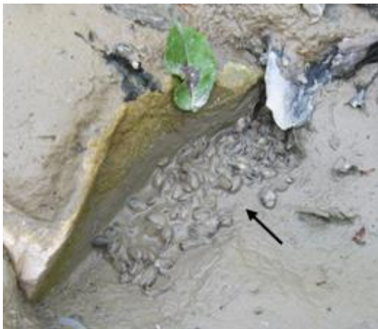
شکل ۱۰: از بین رفتن لاروها در طبیعت

مشاهده تعداد اندکی (کم‌تر از ۱۰ عدد) از بچه قورباغه‌ها نشان داد که بچه‌قورباغه‌های موجود در طبیعت از نظر اندازه حدود ۲ برابر بچه‌قورباغه‌های پرورش یافته در آزمایشگاه می‌باشند (شکل ۱۱).