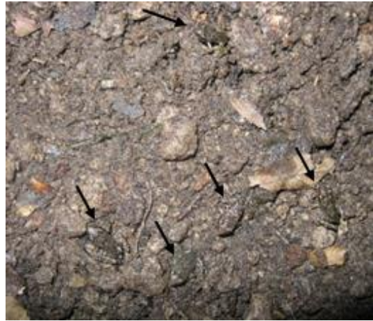
شکل ۸: بچه قورباغه‌ها در محیط خاکی

بین رفتن لاروها به علت خشک شدن آبگیرهای موقتی (شکل ۱۰) نشان می‌دهد، آن جفت‌هایی که حوضچه‌های دائمی و یا میانه آبگیرهای موقتی را برای تخم‌گذاری انتخاب می‌کنند، شانس زنده ماندن تخم‌ها و لاروهای آن‌ها در مراحل بعدی بیش‌تر خواهد بود. بررسی‌های کلی صورت گرفته در طول دوره تولیدمثلی نشان می‌دهد که لاروهای قورباغه جنگلی با رفتن به زیرسنگ‌ها و جلبک‌ها، مکان‌های سایه را بیش‌تر ترجیح می‌دهند، هم‌چنین لاروهای موجود در آب‌های خنک‌تر (به‌عنوان مثال حوضچه‌های دائمی که آب آن‌ها از طریق لوله‌کشی از چشمه کنار رودخانه تامین می‌شد) نیز از نظر اندازه، کمی بزرگ‌تر از سایر لاروها هستند.