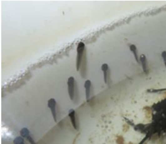
شکل ۵: لاروهای دارای اندام چسبنده

صفتی که در آزمایشگاه مورد بررسی قرار گرفت شامل: وزن برای ۱۳ توده تخم، تعداد تخم با محاسبه (تناسب وزن و تعداد) برای ۱۳ توده، تعداد تخم با شمارش برای ۱۰ توده، درصد جنین‌ها برای ۹ توده، درصد تخم‌های لقاح نیافته برای ۹ توده، میانگین قطر ۲۰ تخم با ژله و بدون ژله برای ۵ توده، میانگین طول لاروها در زمان تفریخ برای ۲ توده، مدت زمان نمونه‌گیری تا تفریخ برای ۱۱ توده، مدت زمان تبدیل لاروهای تفریخ یافته به بچه قورباغه برای ۷ توده است. برای تجزیه و تحلیل داده‌ها نیز از نرم‌افزار SPSS۲۲ و Excel ۲۰۱۳ استفاده گشت.