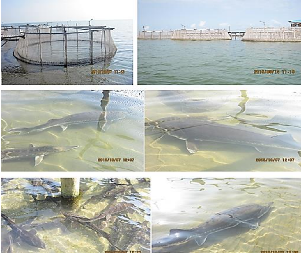
شکل ۱: نمایی از حصارهای پرورشی ماهیان خاوباری در خلیج گرگان

بیولوژیک (BOD 5 ) توسط دستگاه BODtrack-HACH به صورت ماهانه اندازه‌گیری شد. فاکتورهای مصرف اکسیژن شیمیایی (COD) توسط دستگاه HACH-DRB 200، نیتريت (NO 2 - )، آمونیاک کل (NH 3 + ) و فسفات (PO 4 3- )، فسفر کل (P) توسط دستگاه HACH DR ۲۸۰۰ به صورت یک ماه در میان اندازه‌گیری شد. نمونه‌گیری از ناحیه