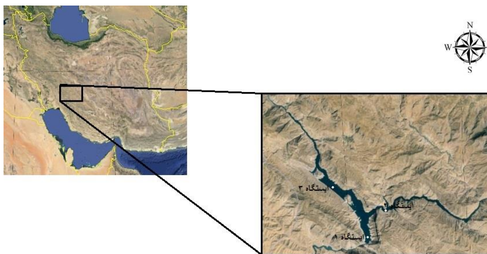
شکل ۱: موقعیت ایستگاه‌های مورد مطالعه در دریاچه سد

فرمالدئید ۴ درصد استفاده گردید. سپس نمونه‌های تهیه شده در یخ و تاریکی قرار داده شدند. نمونه‌ها تا زمان آنالیز در یخچال در آزمایشگاه نگهداری گردیدند. جهت نمونه‌برداری از آب مورد نیاز در اندازه‌گیری pH و اکسیژن محلول (DO) از اعماق میانی آب استفاده گردید. برای اندازه‌گیری اکسیژن مورد نیاز بیوشیمیایی (BOD)، اکسیژن مورد نیاز شیمیایی (COD)، مواد جامد معلق کل (TSS)، نیترات (NO 3 ) و فسفر کل نمونه‌ها پس از نمونه‌برداری از لایه بالایی آب براساس روش‌های بیان شده، عمل گردید (APHA، ۱۹۹۹).