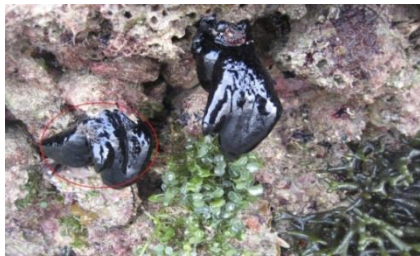
شکل ۳: حضور P. nigra در بستر مصنوعی و رقابت با گونه‌های جلبکی

بسترهای مصنوعی (بقایای کشتی‌های فلزی)، در ناحیه جزر و مدی مشاهده گردید.