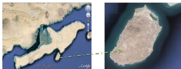
شکل ۱: موقعیت جزیره هنگام در خلیج فارس