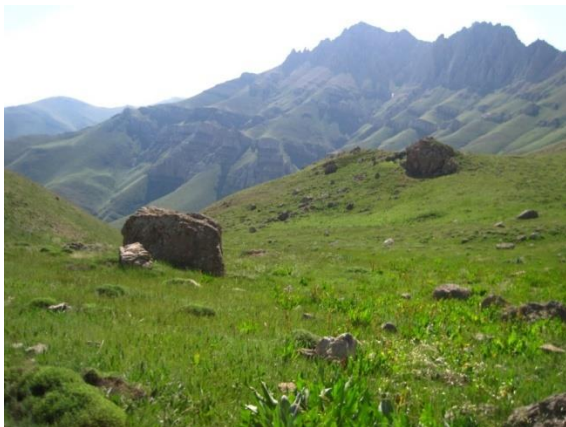
شکل ۱: زیستگاه افعی البرزی در منطقه گلستانک

این گونه به‌طور خاص ساکن علفزارهای کوهستانی و ارتفاعات بالای ۲۴۰۰ متر است (Rajabzadeh و همکاران، ۲۰۱۱). که اغلب دارای ویژگی‌های پوششی مشابه است (شکل ۱).