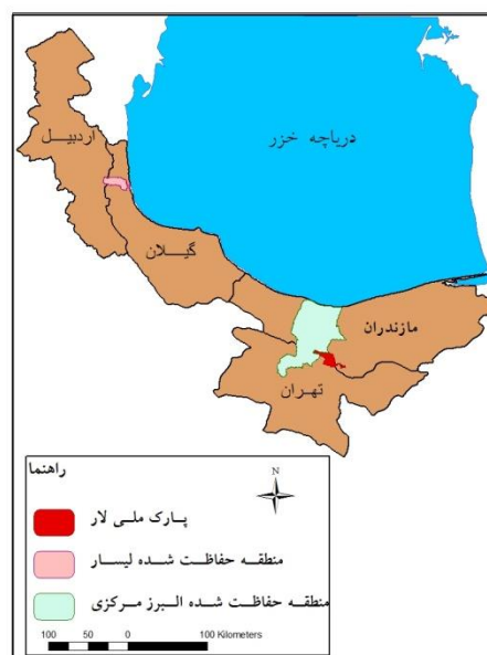
شکل ۲: نقشه موقعیت جغرافیایی مناطق مورد مطالعه

با توجه به این‌که جمعیت‌های افعی البرزی در کوه‌های شمال ایران در امتداد کوه‌های تالش تا جنوب‌شرق آذربایجان حضور دارند، جمع‌آوری اطلاعات صحرایی در چند منطقه از محدوده پراکنش انجام شد. منطقه حفاظت شده البرز مرکزی در استان البرز، منطقه حفاظت شده لیسار در استان اردبیل و پارک ملی لار در استان تهران مناطقی هستند که زیستگاه افعی البرزی در آن‌ها مورد بررسی قرار گرفت (شکل ۲).