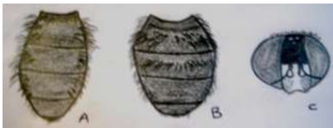
شکل ۵: گونه Cheilosia aerea (A) شکم در نر (B) شکم در ماده (C) چشم در ماده

آذرخش، ی.، ۱۳۸۰. بررسی وضعیت تاکسونومیک و تراکم گونه‌های خانواده Syrphidae در شهرستان لنگرود. پایان‌نامه کارشناسی ارشد، دانشگاه آزاد اسلامی واحد تهران شمال. ۱۴۰ صفحه.