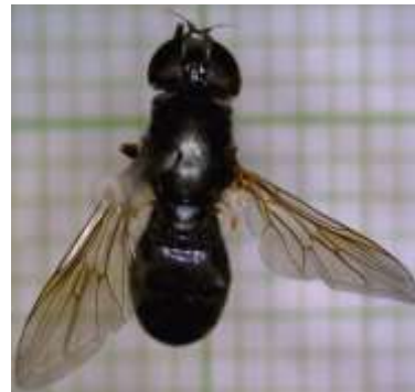
Cheilosia aerea ♀