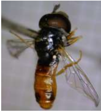
Paragus abrogans ♂