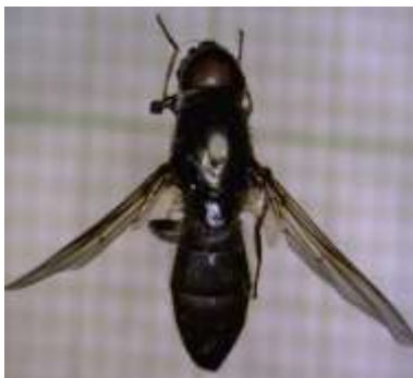
Cheilosia aerea ♂

اندازه بدن ۸-۶ میلی‌متر، چشم‌های مرکب در جنس نر متصل و در ماده‌ها مجزا، چشم‌ها مودار، موهای چشم‌ها به رنگ قهوه‌ای، شاخک سه قسمتی، صورت با موهای برآمده، بند اول و دوم سیاه رنگ، قطعه سوم شاخک به رنگ نارنجی تیره، صورت دارای Knob توسعه یافته در قسمت مرکزی، طول بال ۶/۵-۸/۵