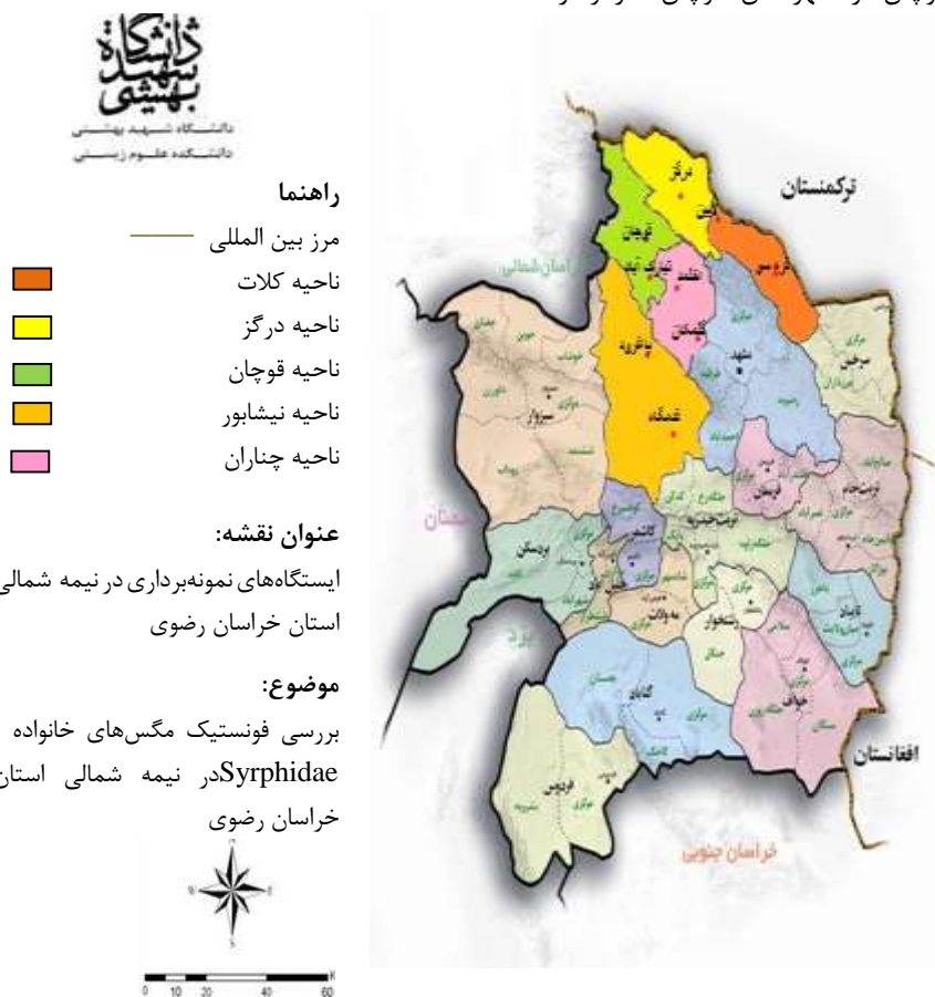
شکل ۱: نقشه ایستگاه‌های مطالعاتی جهت بررسی فون سیرفیده در نیمه شمالی استان خراسان رضوی