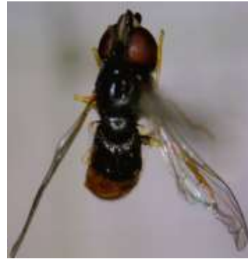
Paragus abrogans ♀