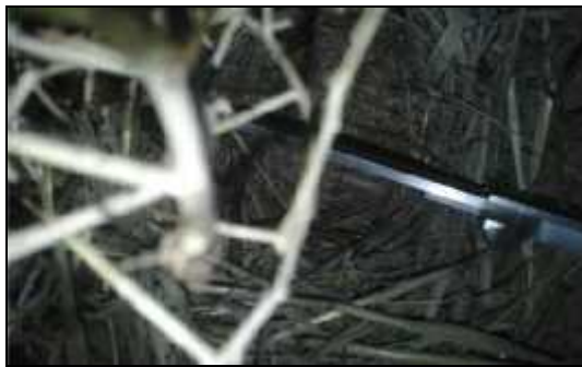
شکل ۳: اندازه‌گیری طول و عرض آشیانه توسط کولیس

خروج آخرین جوجه از لانه در اواخر خردادماه ۱۳۹۴ ادامه یافت که در این مدت، ضمن بررسی و گشت‌زنی در محدوده مورد مطالعه، با یافتن دسته‌های جمعیتی گونه مورد مطالعه، محل لانه‌ها با تعقیب جفت لانه ساز یا چکاوک‌هایی که مواد غذایی را به سمت درختچه‌ها حمل می‌کردند موقعیت‌یابی شد که آشیانه‌های فعال شناسایی و علامتگذاری شد (Bacon و Rotella، ۱۹۹۸؛ Martin و Geupel، ۱۹۹۳). آشیانه‌ها معمولاً با فاصله کمی از هم قرار داشتند اما تعداد لانه‌های فعال کمی یافت شد. پیمایش منطقه به‌منظور یافتن لانه‌های چکاوک کاکلی صورت یک‌روز در میان از ساعت ۷:۳۰ صبح تا ۱۲ ظهر در سطح منطقه مورد مطالعه انجام شد. در نهایت تعداد ۱۶ آشیانه شناسایی و اطلاعات آن‌ها جمع‌آوری و ثبت گردید. در کلیه آشیانه‌ها پارامترهای محیطی آشیانه شامل: طول آشیانه، عرض و عمق آشیانه به‌وسیله کولیس با دقت ۱ میلی‌متر و ارتفاع لانه از سطح زمین به‌وسیله متر با دقت مورد اندازه‌گیری قرار گرفت. هم‌چنین تعداد تخم‌ها در هر آشیانه ثبت شد و طول، عرض و وزن تک‌تک آن‌ها به‌ترتیب توسط کولیس دیجیتال با دقت ۰/۱ میلی‌متر و ترازوی دیجیتال در محل، مورد اندازه‌گیری قرار گرفت (Akris، ۱۹۹۸) (شکل‌های ۳ و ۴). اطلاعات جمع‌آوری شده با استفاده از نرم‌افزار SPSS مورد تجزیه و تحلیل قرار گرفت و آمار توصیفی ارائه گردید. پس از شروع تخم‌گذاری برای اندازه‌گیری و دست زدن به تخم‌ها از دستکش یک‌بار مصرف استفاده گردید.