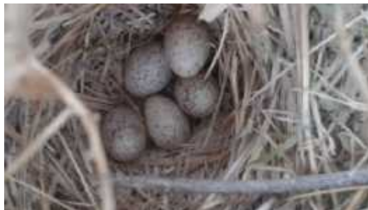
شکل ۴: آشیانه چکاوک کاکلی

تاکنون با وجود فراوانی این گونه در ایران و پالئارتیک مطالعات جامعی بر روی ویژگی‌های بوم‌شناختی و زیست‌شناسی از جمله مهم‌ترین چرخه زندگی آن، یعنی زادآوری صورت نگرفته است (نوری و همکاران، ۱۳۸۶؛ Khaleghizadeh و همکاران، ۲۰۰۵). پژوهش حاضر در منطقه گوری از توابع شهرستان زهک با هدف تعیین فنولوژی تولیدمثل این گونه انجام شده است.