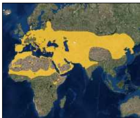
شکل ۱: محدوده پراکنش چکاوک کاکلی در جهان (IUCN, ۲۰۱۴)

چکاوک کاکلی نسبت به چکاوک آسمانی بزرگ‌تر و کم‌رنگ‌تر از آن است. جنس نر و ماده هم شکل و دم کوتاه و تاج بلندش از ویژگی‌های بارز آن است. تنه نخودی خاکستری یا اندکی قهوه‌ای، اما یک‌دست و در پشت گردن خط خطی است که به درستی مشخص نیست و بال‌های کاملاً گردی دارند.