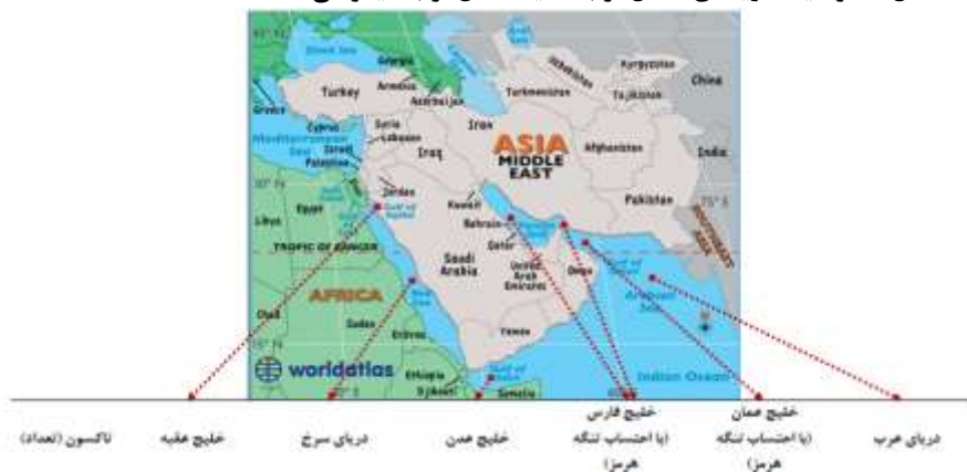
شکل ۲: موقعیت دریاهای شمال غرب ناحیه شمال غرب اقیانوس (NW Indian Ocean region)

کمیت و چگونگی نفوذ و پراکنش گونه‌ها از آب‌های خارج (اقیانوس هند-آرام غربی) به داخل هنوز مشخص نیست و این موضوع هم‌چنان در پرده ابهام باقی است (عوفی و همکاران، ۱۳۹۴). از دیدگاه نظری آب‌های خارج باید گستره دریای عربستان یا در بعد وسیع‌تر غرب اقیانوس هند را دربرگیرند. دریای عربستان به هر صورت در ۸۷/۵٪ از گونه‌ها با خلیج فارس مشترک است و غرب اقیانوس هند همان‌طور که قبلاً نیز ذکر شد به‌طور دقیق تعیین نشده است (Krupp و همکاران، ۱۹۹۷). از کل گونه‌ها (۲۰۷۳) تعداد ۳۳۹ گونه (۱۶/۴٪) در اقیانوس هند محدود شده‌اند و ۷۹۴ گونه (۳۶/۱٪) در هر دو اقیانوس هند و آرام غربی انتشار دارند و ۹۸۵ گونه (۴۷/۵٪) در اقیانوس آرام غربی محدود شده‌اند (Helfman و همکاران، ۱۹۹۹). این ارقام نشان می‌دهند که تعداد گونه‌های اقیانوس آرام غربی سه برابر اقیانوس هند می‌باشد و گونه‌های اقیانوس هند (۳۳۹ گونه) از گونه‌های مشترک هر دو اقیانوس (۷۴۹ گونه) اشتقاق یافته‌اند (Nelson و Asternov، ۱۹۹۹). آن‌چه مسلم است وضعیت خانواده‌های مختلف متفاوت است و مستلزم مطالعات و تحقیقات بیشتر می‌باشد. براساس بررسی منابع و مقایسه جغرافیای