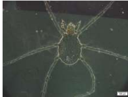
شکل ۱۱: لارو Erythraeus shojaii

کنه‌های موجود در انبارها به دو گروه کنه‌های قارچ‌خوار و گیاهی تقسیم می‌شوند (Al-Shammery, ۲۰۱۴). در بین کنه‌های زبان‌آور محصولات غذایی انباری کنه‌های موسوم به بی‌استگمایان به‌ویژه خانواده Acaridae بیش‌ترین خسارت را وارد می‌کنند که تحت شرایط مناسب می‌توانند به سرعت زیاد شده و جمعیت انبوهی را