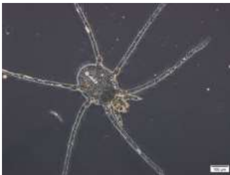
شکل ۱۲: لارو Erythraeus southcottii

پراکنش: تعداد دو نمونه لارو از این گونه در تاریخ‌های ۹۴/۵/۵ و ۹۴/۵/۶ از شهرستان‌ها سقز جمع‌آوری شد.