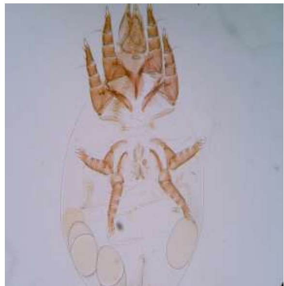
شکل ۲: کنه ماده Rhizoglyphus echinopus

ویژگی‌های رده‌بندی: طول ایدیوزوما ۲۹۵ و عرض آن ۲۰۰ میکرون، طول کلیسر ۱۴۲، طول صفحه پشتی ۱۶۵، فاصله موهای کتفی خارجی از یکدیگر ۱۲۱ میکرون می‌باشد. طول پاهای اول ۲۸۴، پای دوم ۲۸۸، پای سوم ۲۸۷ و پای چهارم ۳۰۷ میکرون می‌باشد. در مورد کنه‌های نر طول ایدیوزوما ۷۱۰ و عرض آن ۴۷۲ میکرون، طول کلیسر ۱۲۶، طول صفحه پشتی ۱۳۸، فاصله موهای کتفی خارجی از یکدیگر ۱۱۴ میکرون می‌باشد. طول پاهای اول ۱۹۵، پای دوم ۱۸۱، پای سوم ۲۱۷ و پای چهارم ۲۴۶ میکرون می‌باشد. پراکنش: تعداد ۱۰ نمونه (۴ ماده، ۴ نر و ۲ هیپوپوس) از این گونه در تاریخ‌های ۹۴/۵/۲۸ و ۹۴/۵/۳۱ از انبارهای کامیاران و بیجار جمع‌آوری شد.