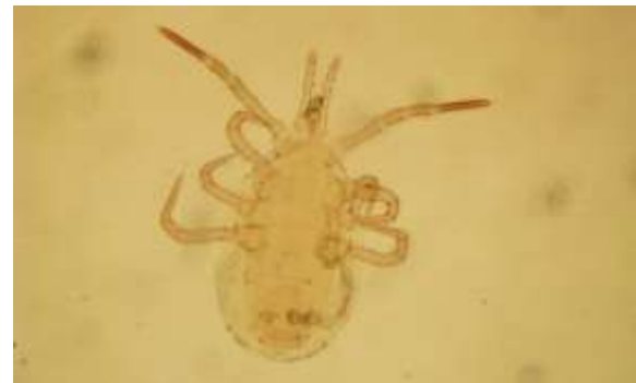
شکل ۸: کنه ماده Blattisocius keegani

ویژگی‌های رده‌بندی: کورنیکول‌ها جدا و باریک، تکتوم محدب است. پریتریم کوتاه و تحلیل رفته و از پیش‌ران پای دوم نمی‌گذرد که در سطح روزنه تنفسی کم عرض می‌باشد. موی شانه‌ای (I+) عموماً کنار صفحه پشتی کوتیکول قرار دارد، انگشت ثابت کلیسر کوتاه و در بیش‌تر موارد نصف انگشت متحرک طول دارد. انگشت متحرک دارای یک دندانانه است. پراکنش: تعداد ۶ کنه ماده از این گونه در تاریخ ۹۴/۲/۲ از شهرستان سنندج جمع‌آوری شد.