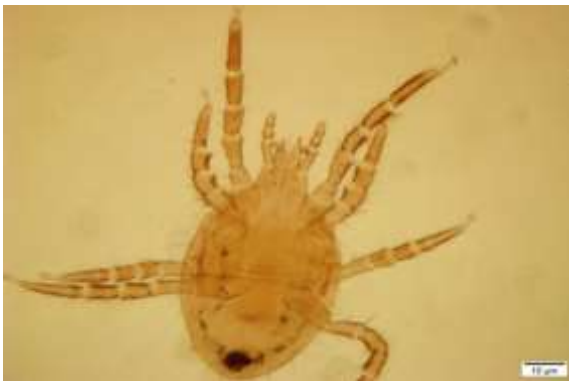
شکل ۱۰: کنه نر Pneumolaelaps lubrica

ویژگی‌های رده‌بندی: تکتوم صاف، هر ردیف از شیار زیر دهانی دارای ۲ تا ۶ دندانانه است. پریتریم بلند و تا بعد از قسمت میانی پیش‌ران اول امتداد دارد، انگشت متحرک کلیسر دو دندانانه و صفحه پشتی به طول تقریبی ۳۰۰ و عرض ۲۰۰ میکرون است. صفحه جنسی توسعه نیافته، یک یا دو جفت مو بین صفحات جنسی و مخرجی وجود دارد. پراکنش: تعداد سه نمونه (۲ ماده ۱ نر) از این گونه در تاریخ‌های ۹۴/۲/۱۳ و ۹۴/۵/۳۱ از شهرستان‌های مریوان و بیجار جمع‌آوری شد.