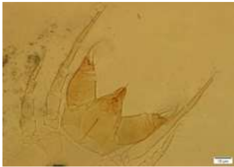
شکل ۶: کنه ماده Cheyletus eruditus

ویژگی‌های رده‌بندی: پالپ کوتاه و دارای یک برجستگی در بخش بیرونی است. پاها کوتاه‌تر از ایدوزوما هستند. طول پاهای جفت اول ۳۴۶، جفت دوم ۳۱۰، جفت سوم ۳۱۴ و جفت چهارم ۴۰۱ میکرون است. ساق پای چهارم دارای دو مو است. سولنیدی ۱ کوتاه است و موی محافظ (Guard seta) روی پنجه پاهای اول بزرگ‌تر از آن است. صفحات سینه‌ای وجود ندارد. پنجه معمولاً دارای یک تا دو موی شانه مانند دارد. کلیسرها سوزنی شکل بوده و فاقد چشم هستند. طول صفحه پروپودونوتال کم‌تر از ۱/۵ برابر صفحه هیسترونوتال است. طول موی d_1 کم‌تر از فاصله بین صفحات پروپودونوتال و هیسترونوتال است. پراکنش: فعالیت C. eruditus در کاهش جمعیت کنه A. siro در فرآورده‌های انباری به طرز چشمگیری مؤثر می‌باشد. یک کنه ماده از این گونه در تاریخ ۹۴/۳/۱۰ از شهرستان مریوان جمع‌آوری شد.