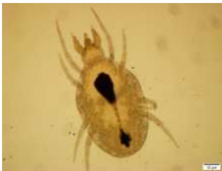
شکل ۷: کنه ماده Acaropsis sollers

ویژگی‌های رده‌بندی: موی موجود در روی شانه نخی شکل، بزرگ‌تر از موی کناری است. در روی صفحه هیسترونوتال ۵ جفت موی وجود دارد. جفت اول پاها کوتاه‌تر از بدن است. پراکنش: تعداد ۵ نمونه کنه ماده از این گونه از سنندج در تاریخ ۹۴/۲/۲ جمع‌آوری شد.