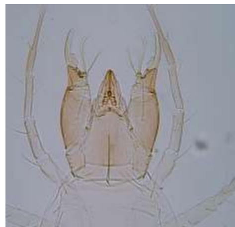
شکل ۵: کنه ماده Cheyletus malaccensis

پراکنش: تعداد ۱۲ نمونه (۱۰ ماده، ۲ نر) از این گونه از انبارهای سنندج، کامیاران، دیواندره و بیجار در تاریخ‌های ۹۴/۵/۹، ۹۴/۵/۲۷، ۹۴/۵/۲۸ و ۹۴/۵/۳۱ جمع‌آوری شد.