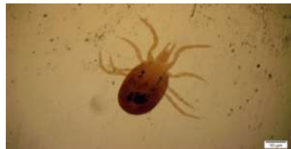
شکل ۹: کنه ماده Liponyssoides sanguineus

ویژگی‌های رده‌بندی: کلیسر استایلی شکل، سپر پشتی یک پارچه یا دارای یک سپرچه خلفی است. صفحه پیژیديال جدا است. صفحه شکمی دارای ۳ جفت مو، صفحه جنسی دارای یک جفت مو و خنجری شکل و صفحه مخرجی نسبتاً بزرگ است. پریتریم خیلی کوتاه است. موی ۳ روی تریتو استرونوم وجود دارد. پراکنش: تعداد یک کنه ماده از این گونه از شهرستان مریوان در تاریخ ۹۴/۳/۱۱ جمع‌آوری شد.