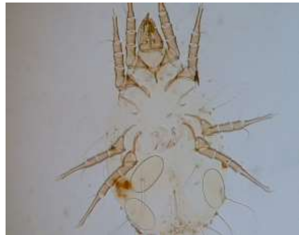
شکل ۴: کنه ماده Tyrophagus putrescentiae