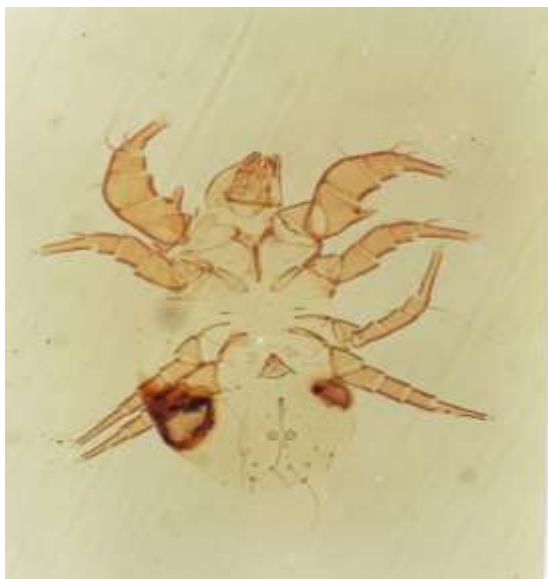
شکل ۳: کنه نر Acarus siro

پراکنش: کنه‌های آرد در اغلب نقاط جهان انتشار دارند و تا کنون از کشورهای زیادی گزارش شده است. این کنه همه جایی بوده و در تمام مناطق دنیا وجود دارد. تعداد ۳ نمونه (۲ کنه ماده، یک کنه نر) از این گونه در تاریخ ۹۴/۵/۳۱ از شهرستان بیجار جمع‌آوری شد.