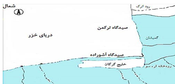
شکل ۱: نقشه مناطق مورد بررسی و نمونه برداری شده

نمونه برداری: در خرداد ماه سال ۱۳۹۴ تعداد ۹۰ قطعه ماهی کپور وحشی از تالاب گمیشان، خلیج گرگان و رودخانه قره‌سو واقع در استان گلستان به صورت تصادفی صید گردید. حدود ۱ گرم از باله دمی ۳۰ ماهی از هر منطقه جداسازی و تا شروع استخراج DNA در تیوب‌های حاوی الکل اتیلیک ۹۶٪ تثبیت گردیدند. نمونه‌ها جهت انجام آزمایشات مولکولی به آزمایشگاه ژنتیک و بیوتکنولوژی آبیان دانشگاه علوم کشاورزی و منابع طبیعی گرگان انتقال و تا شروع آزمایشات در یخچال در دمای ۴- درجه سانتی‌گراد قرار داده شدند.