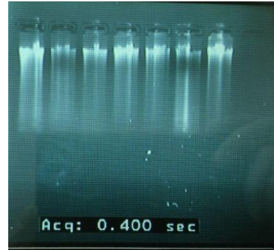
شکل ۲: تصویر ژل آگارز یک درصد جهت ارزیابی کیفیت DNA با استفاده از الکتروفورز افقی

PCR توسط دستگاه ترموسایکلر ساخت شرکت (BIO-RAD) انجام شد. ویژگی‌های مربوط به جایگاه‌های مورد استفاده در جدول ۱ آورده شده است. واکنش‌های زنجیره ای پلی‌مرز برای هر یک از آغازگرها براساس بهترین دمای الحاق طی مراحل دناتوره شدن، الحاق و بسط در دستگاه ترموسایکلر صورت پذیرفت. در این راستا تکثیر جایگاه‌های ژنی طی واکنش زنجیره‌ای پلی‌مرز با استفاده از ترکیبی شامل DNA، آغازگرها، کیت مخصوص PCR و آب مقطر با حجم نهایی ۱۲/۵ میکرولیتر انجام گردید. در نهایت محصولات PCR روی ژل اکریل آمید ۸٪ (غیریونیزه) جداسازی شدند. سپس ژل‌های به دست آمده از الکتروفورز عمودی به روش نیترا نقره رنگ آمیزی و تصاویر مربوطه توسط دستگاه مستندساز ژل (Gel Doc XR, BIO-RAD) ثبت شد. در نهایت طول قطعات با استفاده از نرم‌افزار Gel Pro Analyzer ۶.۵ محاسبه گردید.