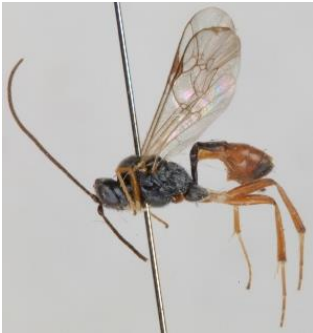
شکل ۴: گونه Netelia (Netelia) rufescens

محل و تاریخ جمع‌آوری: (۱♂) مازندران، سوادکوه، اوریم، ۱۸ مرداد ۱۳۹۴. گزارش جدید برای فون ایران (شکل ۴).