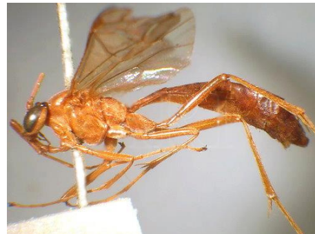
شکل ۳: گونه Hyposoter ebeninus

محل و تاریخ جمع‌آوری: (۱♂) مازندران، آمل، آهنگر کلا، ۲۱ شهریور ۱۳۹۴. گزارش جدید برای فون ایران (شکل ۳).