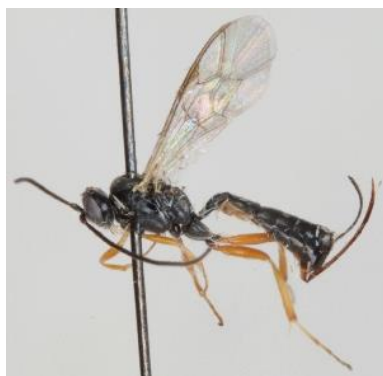
شکل ۱: گونه Diadegma consumptor

گونه Diadegma fenestralis (Holmgren, 1860)