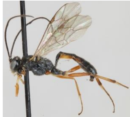
شکل ۲: گونه Diadegma fenestralis

براساس نتایج این پژوهش، فون متنوعی از زنبورهای پارازیتوئید Ichneumonoidea در مزارع برنج مازندران و مناطق اطراف (شامل مزارع، باغات و نواحی جنگلی) فعالیت دارند که نقش مهمی در کنترل گروه‌های مختلف آفات ایفاء می‌نمایند. در رابطه با زنبورهای خانواده Ichneumonoidea مزارع برنج ایران، نخستین بار Rezvani و Shah-hosseini (۱۹۷۶) دو گونه زنبور نامشخص از خانواده Ichneumonidae و یک گونه زنبور ( Apanteles sp.) از خانواده Braconidae را به‌عنوان پارازیتوئیدهای لارو و شفیره کرم ساقه‌خوار برنج از مازندران گزارش نمودند. براساس پژوهش‌های صورت گرفته توسط Ghahari و همکاران (۲۰۰۸) هفده گونه زنبور از بالاخانواده Ichneumonoidea از مزارع برنج مناطق مختلف کشور گزارش گردیدند (سه گونه از خانواده