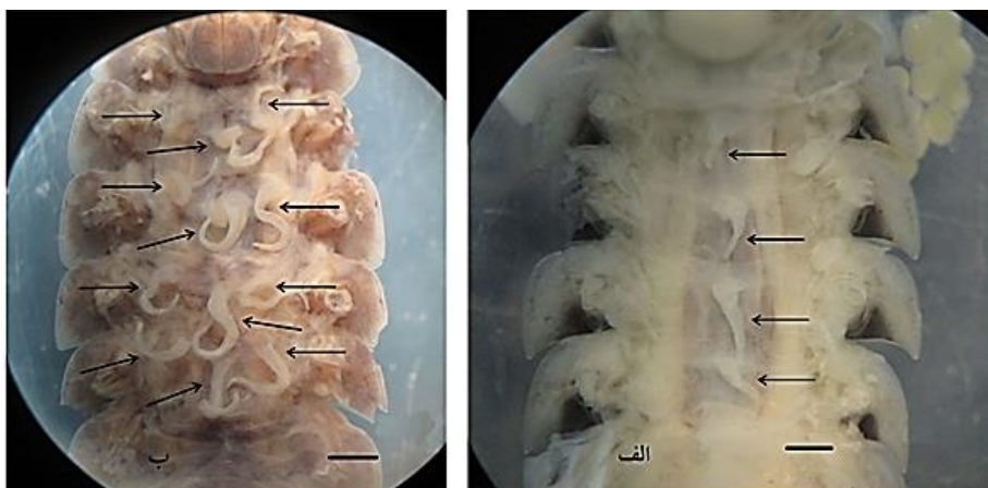
شکل ۲: الگوی توزیع کوتیلدون‌ها در دو گونه جورپای خشکی زی، الف - Porcellio mehrdadi ، ب - Protracheoniscus major (مقیاس امیلی متر)

نمی‌دهد و این که P. major که در آن تعداد ۱۲ کوتیلدون وجود دارد، نسبت به برخی از گونه‌ها، زیستگاه‌های مرطوب‌تر را ترجیح می‌دهد. به‌طور مشابه، به‌نظر می‌رسد که بین اندازه نسبی این ساختارها و نوع زیستگاه گونه‌ها ارتباط وجود ندارد.