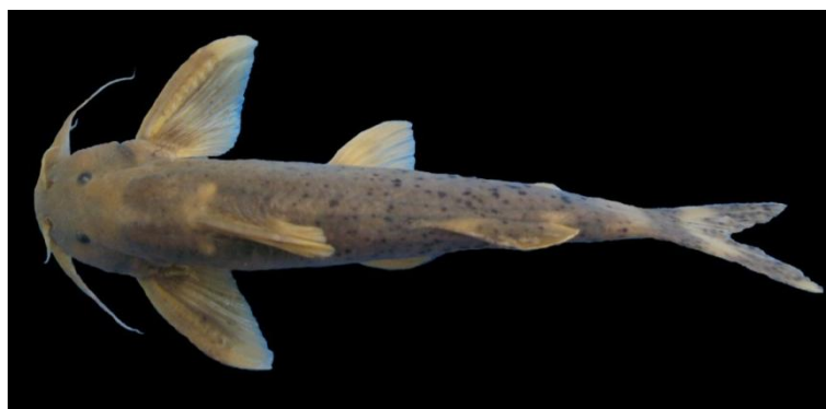
شکل ۱: تصویر نمونه‌ای از گربه‌ماهی سیسورید جنوبی ( G. silviae )