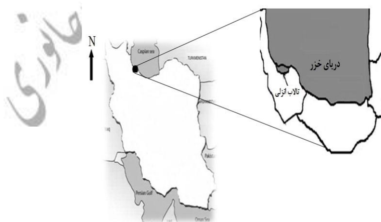
شکل ۱: منطقه مورد مطالعه

تالاب انزلی به‌علت قرارگرفتن در یک منطقه پرجمعیت و استقرار صنایع آلاینده بسیار در اطراف آن، از آلودگی بسیار بالایی برخوردار می‌باشد. همچنین رودخانه‌هایی که به تالاب