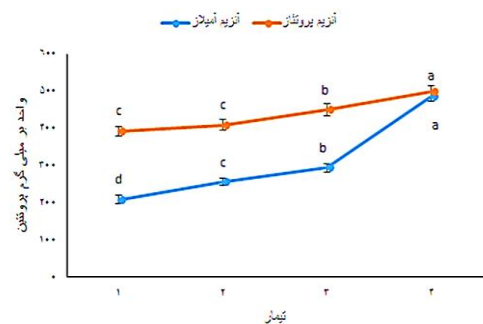
شکل ۳: میانگین و خطای معیار میزان فعالیت آنزیم آمیلاز و پروتئیناز روده ماهی کفال خاکستری در تیمارهای مختلف (۰، ۵۰، ۱۰۰ و ۱۵۰ گرم عصاره جلبک جانیا در هر کیلوگرم غذا) در پایان دوره آزمایش حروف نامشابه در هر ستون نشان دهنده اختلاف معنی دار بین تیمارها است ( p < 0.05 ).