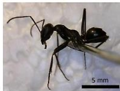
شکل ۹: گونه Cataglyphis setipes (Forel, 1894) (a) سر (b) بدن (تصویر از نگارنده)

گونه (شکل ۱۰) Cataglyphis lividus (André, 1881) : اندازه ۳/۵ تا ۸ میلی‌متر، رنگ بدن نارنجی مایل به زرد، شکم براق، ناحیه پس‌سر فاقد موهای زبر و ایستاده، سومین پالپ آرواره‌ای با موهای کوتاه، حاشیه جلویی کلایپئوس با موهای بلند، منافذ تنفسی پروپوڈئوم کشیده، پتیول مخروطی شکل، سطح پشتی بدن فاقد موهای ایستاده. این گونه از تمام ایستگاه‌ها به جز ایستگاه کوه دربندشور و در ماه‌های فروردین، مهر و آبان جمع‌آوری گردید.