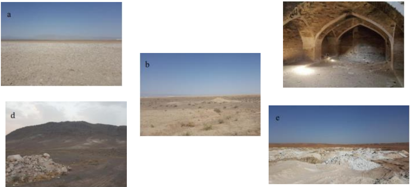
شکل ۲: ایستگاه‌های مطالعاتی: (a) دریاچه نمک (بخش مرکزی)، (b) دریاچه نمک (بخش حاشیه‌ای)، (c) کاروانسرای تاریخی صدر آباد، (d) کوه دربندشور، (e) شوره‌زارهای قمروود