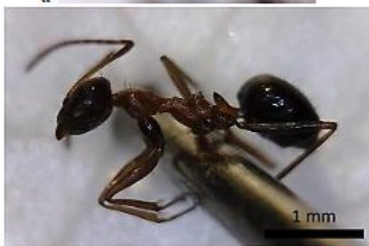
شکل ۱۱: گونه Lepisiota dolabellae (Forel, 1911) (a) سر (b) بدن (تصویر از نگارنده)