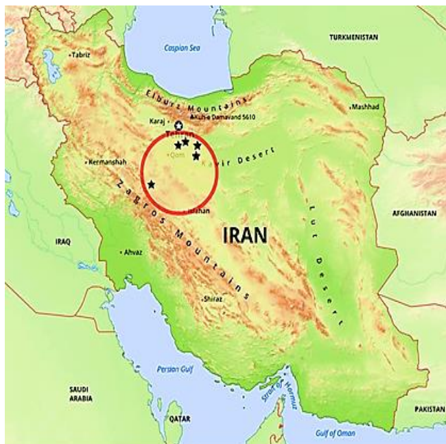
شکل ۱: نقشه محدوده ایستگاه‌های مطالعاتی در نواحی مرکز ایران

نواحی شوره‌زار و باتلاق‌های نمکی مناطق مرکزی ایران (شکل ۱) را به ۵ ایستگاه به نام‌های دریاچه نمک (بخش مرکزی)، دریاچه نمک (بخش حاشیه‌ای)، کاروانسرای تاریخی صدرآباد، کوه دربندشور با ارتفاع ۱۴۲۷ و شوره‌زارهای قمرود به ترتیب با طول جغرافیایی 50^{\circ}90' \pm 1^{\circ}10' و عرض جغرافیایی 34^{\circ}43' \pm 0^{\circ}55' (شکل ۲) تقسیم کرده و نمونه‌برداری از آن‌ها به روش تله‌گذاری (Pit fall) و دستی در دفعات و زمان‌های برابر طی ۳ فصل بهار، تابستان و پاییز انجام گرفت. نمونه‌های جمع‌آوری شده در لوله‌های آزمایش پلاستیکی در دارحای الکلی ۷۰٪ به آزمایشگاه بیوسیستماتیک دانشگاه شهید بهشتی انتقال داده شد و با استفاده از کلیدهای شناسایی معتبر مانند: Hashimoto (۲۰۰۳)، Radchenko (۱۹۹۸)، Collingwood و Agosti (۱۹۹۶)، Bolton (۱۹۹۴)، Goulet و Hubert (۱۹۹۳)، Collingwood (۱۹۸۵) و به کمک استرئومیکروسکوپ مورد شناسایی قرار گرفتند. از صفات کلیدی، عکس‌های لازم به وسیله دوربین داینو تهیه گردید.