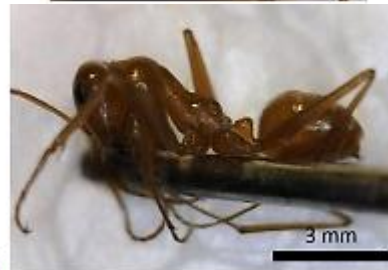
شکل ۱۰: گونه Cataglyphis lividus (André, 1881) (a) سر (b) بدن