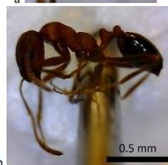
شکل ۴: گونه Monomorium indicum (Forel, 1902) (سر (a) بدن (b))