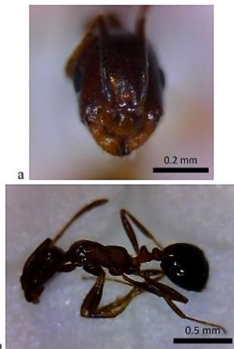
شکل ۵: گونه Monomorium rimae sp. (Collingwood & Agosti, 1996) (سر (a) بدن (b))

(بخش حاشیه‌ای) و کوه دربندشور در ماه‌های فروردین، تیر، شهریور و مهر جمع‌آوری گردید.