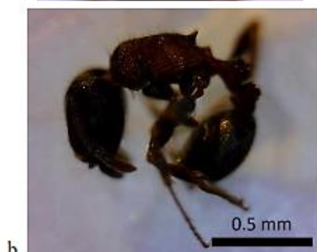
شکل ۶: گونه Tetramorium sp. (Mayr, 1855) (سر (a) بدن (b) تصویر از نگارنده)

گونه Monomorium rimae sp. (Collingwood & Agosti, 1996) بدن دو رنگ، سر، شکم و پاها قهوه‌ای تیره و براق، آلیترانک روشن‌تر، سر و آلیترانک با نقوش مشبک، شاخک ۱۲ بندی، بند انتهایی شاخک بلندتر از ۲ بند قبلی، پتیول کمی بلندتر از پتیول عقبی، پتیول و پتیول عقبی هر کدام با یک جفت تار مو. این گونه تنها از ایستگاه دریاچه نمک (بخش حاشیه‌ای) و در ماه فروردین جمع‌آوری گردید (شکل ۵). قبیله Crematogastrini (Forel, 1893): این قبیله از زیرخانواده Myrmicinae دارای ۷۲ جنس می‌باشد که ۸ جنس از آن منقرض شده است. از این قبیله ۱ جنس و یک گونه جمع‌آوری و شناسایی گردید. جنس Tetramorium (Mayr, 1855): شاخک‌ها ۱۲ بندی، سطح پشتی سر و سینه با شیارهای طولی، ناحیه شکم از نمای پشتی گلابی شکل. گونه (شکل ۶) Tetramorium sp. (Mayr, 1855): رنگ سر و شکم قهوه‌ای مایل به مشکی، شاخک‌ها، پاها و سینه به رنگ قرمز تیره، سطح پشتی سینه با موهای پراکنده، خار ساق پاها میانی و عقبی ساده، پروپودنوم با خارهای نسبتاً بلند، سطح پشتی پتیول با نقش و نگارهای ضخیم، پتیول و پتیول عقبی تقریباً چهارگوش، پتیول عقبی متصل به قسمت قدامی میانی اولین بند شکم. این گونه تنها از ایستگاه کوه دربندشور و در ماه‌های شهریور و آبان فروردین جمع‌آوری گردید.