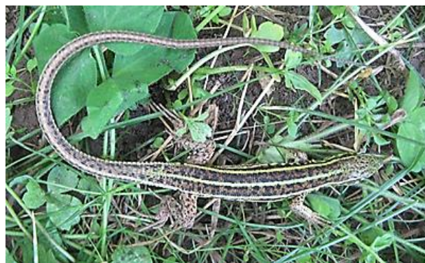
شکل ۱: لاسرتای سه خط در زیستگاه طبیعی آن در استان همدان، ملایر (عکس از نگارنده)

یکی از روش‌های جدید در زیست‌شناسی حفاظت، ارزیابی و پیش‌بینی مناسب‌ترین و مساعدترین زیستگاه برای حضور موجودات زنده است (Phillips و همکاران، ۲۰۰۶). روش حداکثر بی‌نظمی (Maximum Entropy) به‌عنوان روشی شناخته شده در بین زیست‌شناسان برای این منظور به‌کار می‌رود. در سال‌های اخیر، تغییرات ایجاد شده در زیستگاه‌ها، تغییرات اقلیمی، گرمای جهانی، دخالت انسان در زیستگاه‌ها، توسعه صنایع و افزایش میزان چرای دام‌ها توانسته به‌میزان زیادی اندازه جمعیت گونه‌های مختلف را تحت تأثیر قرار بدهد و آن‌ها را دچار کاهش بسیار زیادی نماید (Sasaki و همکاران، ۲۰۱۵). مدل‌سازی پراکنش گونه‌ای (species distribution modeling) به‌کمک زیست‌شناسان حفاظت آمده است تا بتوانند عوامل اقلیمی مؤثر بر حضور گونه‌های مختلف را بیابند و برای یافتن زیستگاه‌های جدید مناسب تلاش نمایند (Soberon و Peterson، ۲۰۱۲). طی سال‌های اخیر بسیاری از زیستگاه‌های جانوران در ایران دچار تهدید جدی شده و با تخریب شده است (Smid و همکاران، ۲۰۱۴). جانوران ساکن در زیستگاه‌ها دچار تنش‌های زیادی شده‌اند و به آن‌ها پاسخ‌هایی هم‌چون تغییر در دامنه پراکنش، کاهش اندازه جمعیت و یا حتی احتمال انقراض را خواهند داد (Bickford و همکاران، ۲۰۱۰). خزندگان به‌عنوان یکی از عناصر کلیدی در هرم غذایی اکوسیستم‌های مختلف نیز تحت تأثیر این تغییرات قرار گرفته‌اند طوری که تراکم آن‌ها در زیستگاه‌های مساعد برای حضور بسیار کاهش یافته است. لاسرتای سه خط یکی از سوسماران خانواده لاسرتیده است که دامنه پراکنش گسترده‌ای در نواحی غربی و شمال‌غربی ایران دارد و عمدتاً در باغات و دره‌های پرآب مشاهده می‌شود (شکل ۱) (Anderson، ۱۹۹۹).