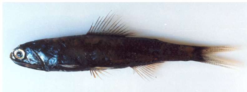
شکل ۲: گونه D. effulgens