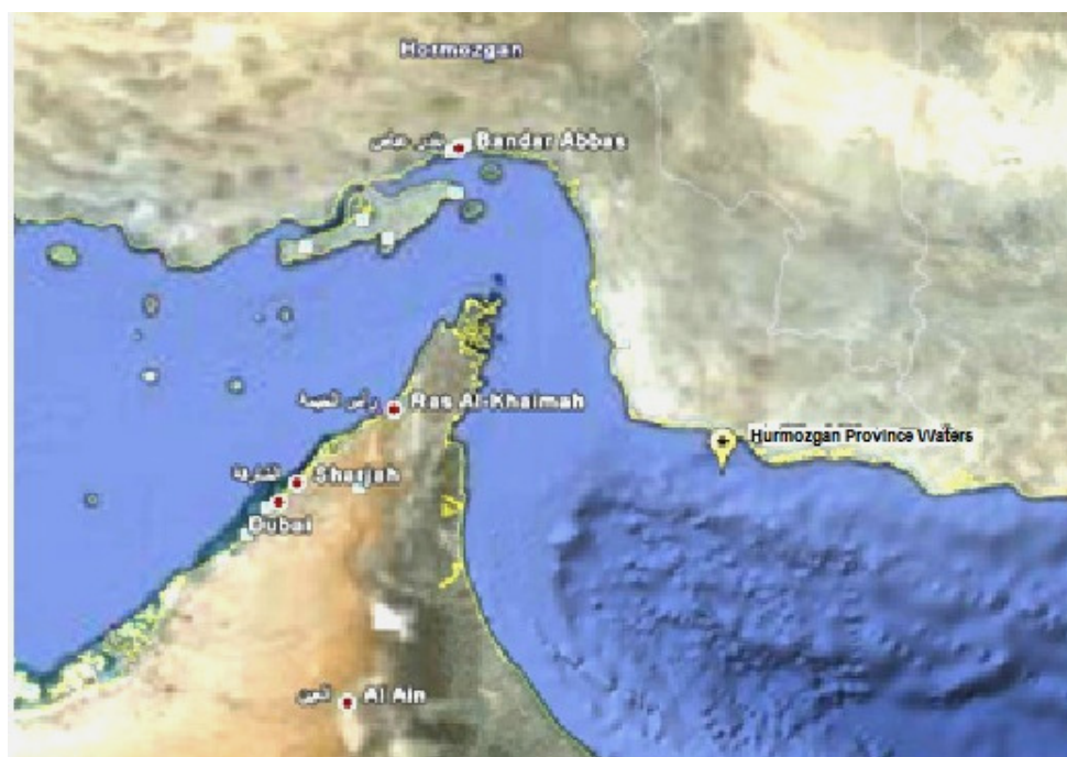
شکل ۱: منطقه نمونه برداری گونه D. effulgens (اقتباس از Google Earth)

در تمام مدت زمان تحقیق تنها یک نمونه از گونه مورد نظر صید گردید. رنگ بدن در گونه D. effulgens تیره می‌باشد. چشمها بزرگ و پوزه کوتاه است. آراره تا فاصله دورتری از چشم کشیده می‌شود. باله چربی دارند. باله دمی چنگالی است. باله شکمی بعد از باله سینه‌ای قرار گرفته است و محل شروع آن اندکی بعد از محل شروع باله پشتی است. باله مخرجی نیز کمی پس از خاتمه باله پشتی شروع می‌شود. این گونه فاقد لکه نوری SO (Suborbital) ولی دارای لکه Ant (Antorbital) می‌باشد. لکه Vn (Ventronasal) در بخش اعظم کل ناحیه پوزه از قسمت پشتی بین حاشیه جلویی چشم و بینی گسترده شده است و با لکه Dn (Dorsonasal) در ارتباط می‌باشد. خصوصیات مورفومتریک و مریستیک گونه D. effulgens در جدول ۱ آورده شده است.